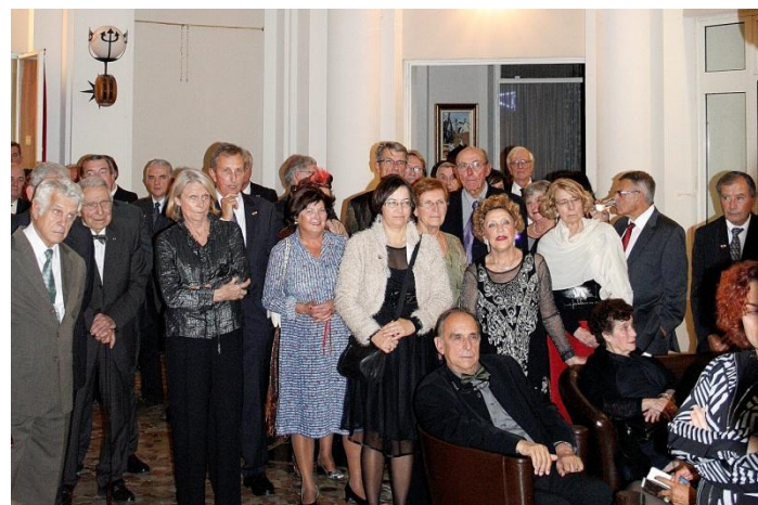
De nombreux membres sont venus fêter Thanksgiving au Cercle Naval de Toulon