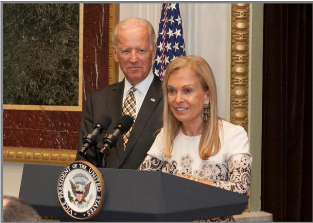
L'Ambassadeur Jane Hartley avec Vice-Président Joseph Biden, Washington DC, 15 octobre 2014

L'Ambassadeur Jane Hartley a été nommée par le Président Barack Obama le 6 juin 2014 Ambassadeur des Etats-Unis d'Amérique en France et à Monaco, et a été confirmée à ces deux postes par le Sénat américain le 16 septembre 2014. Elle a prêté serment le 15 octobre 2014 devant le Vice-Président Joseph Biden.